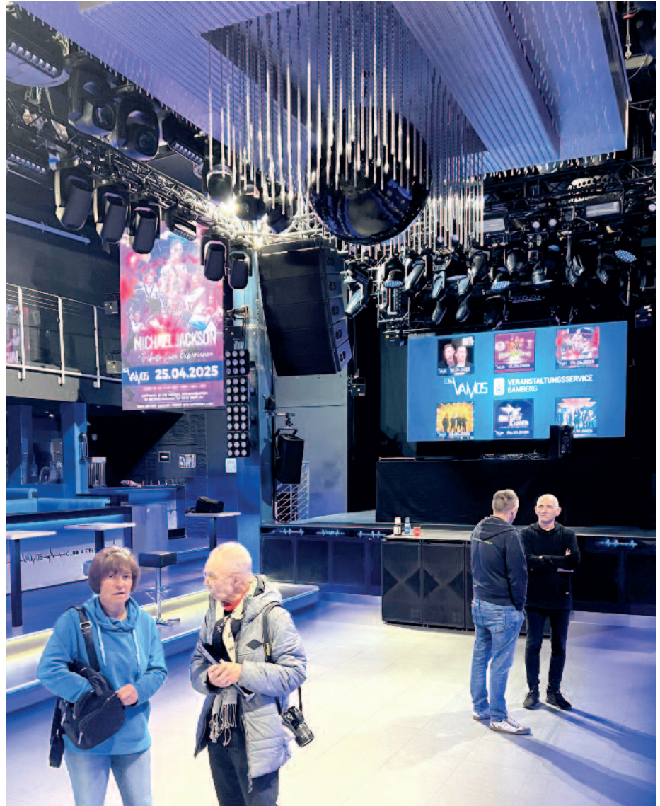
Der Himmel hängt nicht voller Geigen, sondern Licht-Effekte – Blick ins neue Vamos während der Programmvorstellung