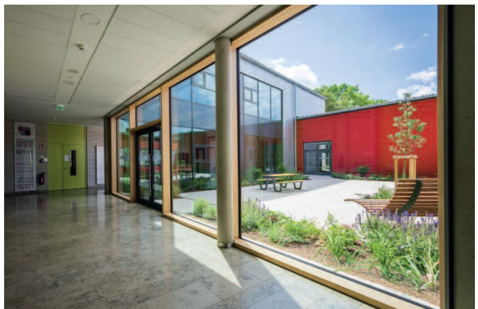
Zum Start ins neue Schuljahr wurde die Realschule Scheßlitz saniert und ausgebaut.

An der Staatlichen Realschule Scheßlitz tut sich was: Die Schule wird derzeit saniert und ausgebaut. Inzwischen sind fast alle Unterrichtsräume zu digitalen Klassenzimmern nach den modernsten Standards umgestaltet worden. Zu Beginn des neuen Schuljahres werden die Sanie-