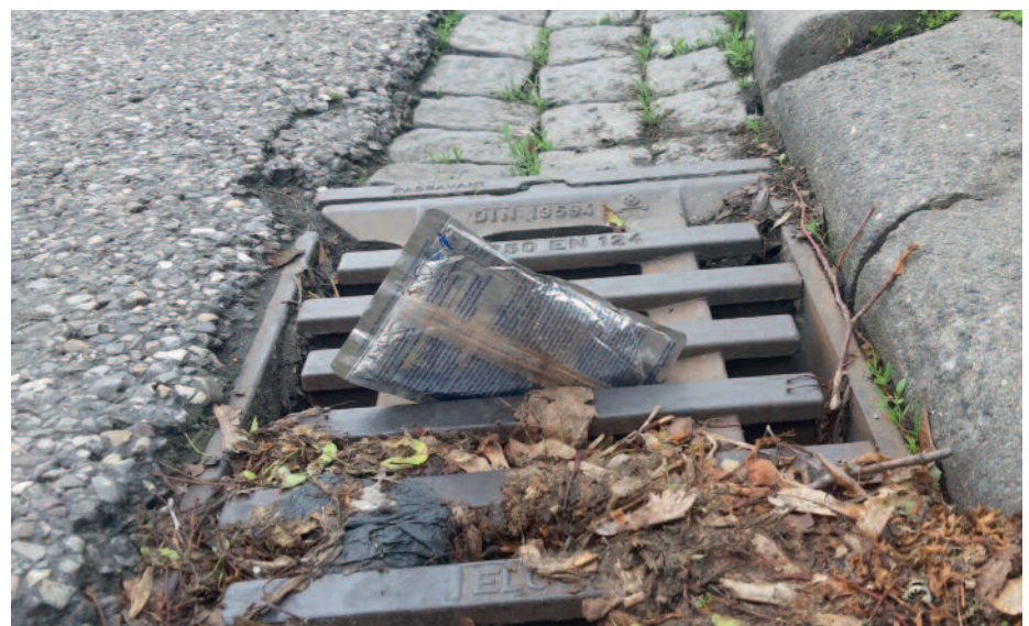
Viel Verpackungsmüll landet oft unabsichtlich auf der Straße und gelangt als Mikroplastik über die Flüsse letztlich ins Meer.

offenen Gruppe anschließen. Das Tolle dabei ist, dass man sichtbar was für die Umwelt vor der eigenen Haustüre tut und das gemeinsame Müll-Sammeln sogar richtig Spaß machen kann. 2024 waren von Creußen und Himmelkron in Oberfranken bis Hochheim am Main 72 Gruppen aktiv.