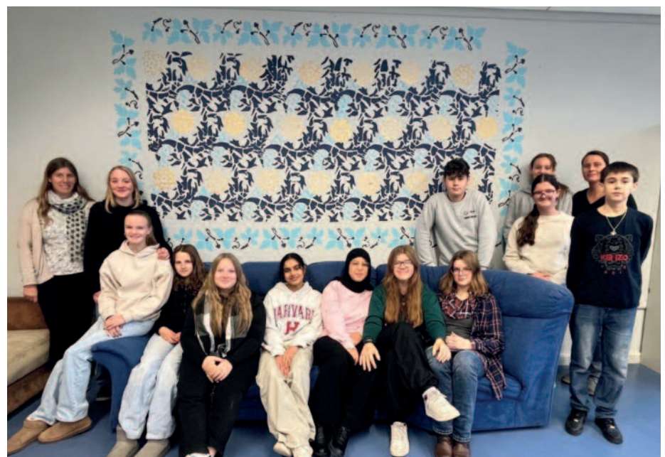
Schule Hallstadt, Freizeitzimmer

Im Vorfeld haben die Jugendlichen in der Gaustadter St.-