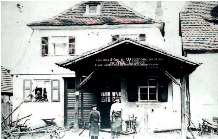
Historische Aufnahme des Anwesens Bamberger Straße 31, hier noch mit dem Holzvorbau, der durch einen Unfall zerstört wurde.

stehen – eine Entscheidung, die sich auszahlen sollte.