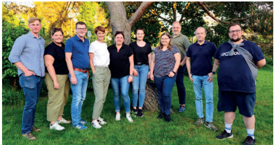
Rund um die neue Abteilungsleitung gibt es ein starkes und motiviertes Team aus Trainern, Spielerinnen und Spielern.

Nach einer erfolgreichen Saison 2023/2024 stehen nun schon wieder alle in den Startlöchern, um ihre hervorragenden Ergebnisse aus der vergangenen Saison stetig zu verbessern. Mit viel Engagement und Ehrgeiz wird